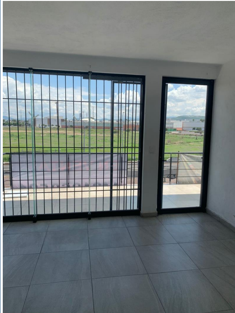
■ Gran amplitud