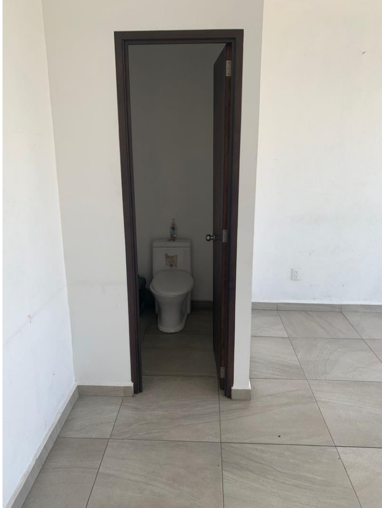
■ Lavabo y WC